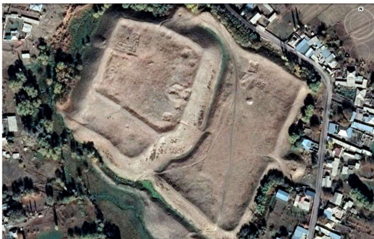
Рис. 1. Цитадель и шахристан городища Аспара на космоснимке Google Earth.