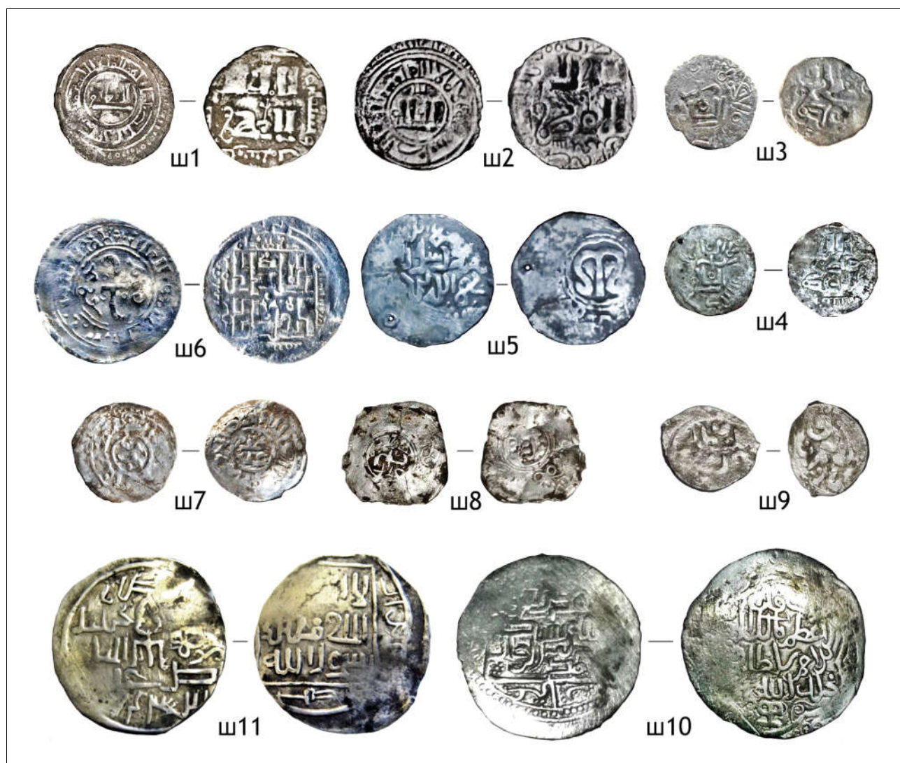
Фототаблица 3. Монеты из находок на городище Шиш-тобе.

Первая половина XV в. Серебряная монета: акча — [Аллах?] Орду Базар, Барак хан, без года — 1 экз. (фототабл. 3: ш9).