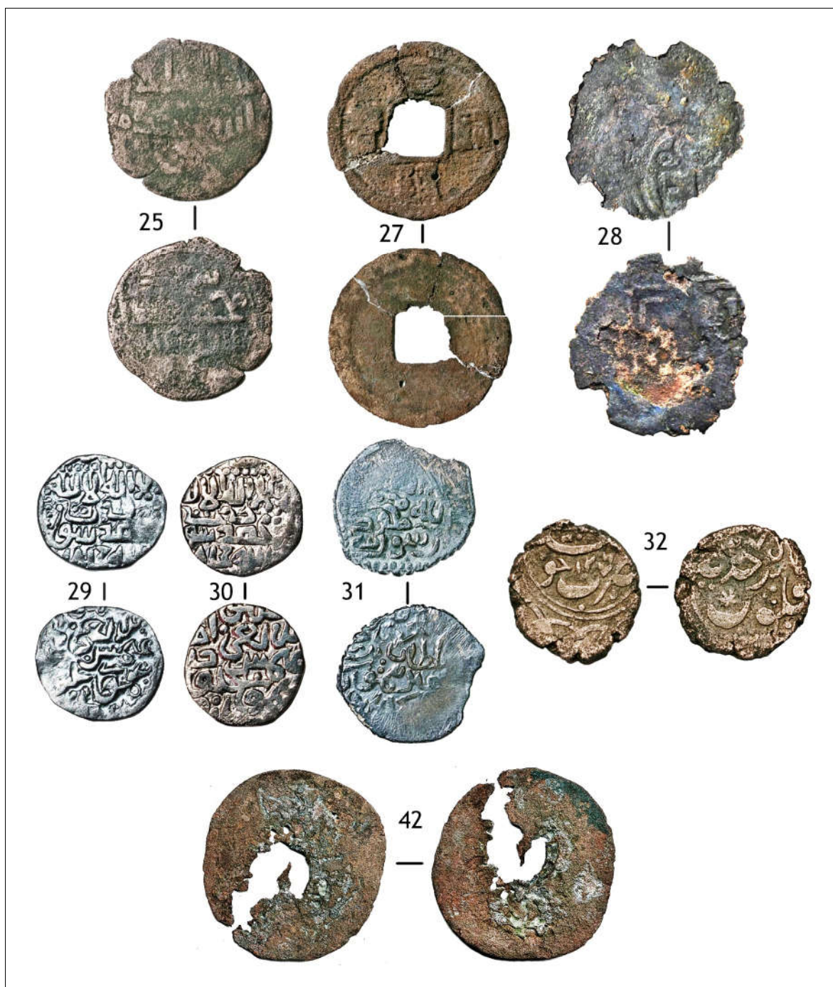
Фототаблица 2. Монеты из находок с городища Аспара. Номера монет соответствуют номерам в таблицах 1 и 2.

Photo table 2. Coins from the finds at the settlement of Aspara. The coin numbers correspond to the numbers in Tables 1 and 2.