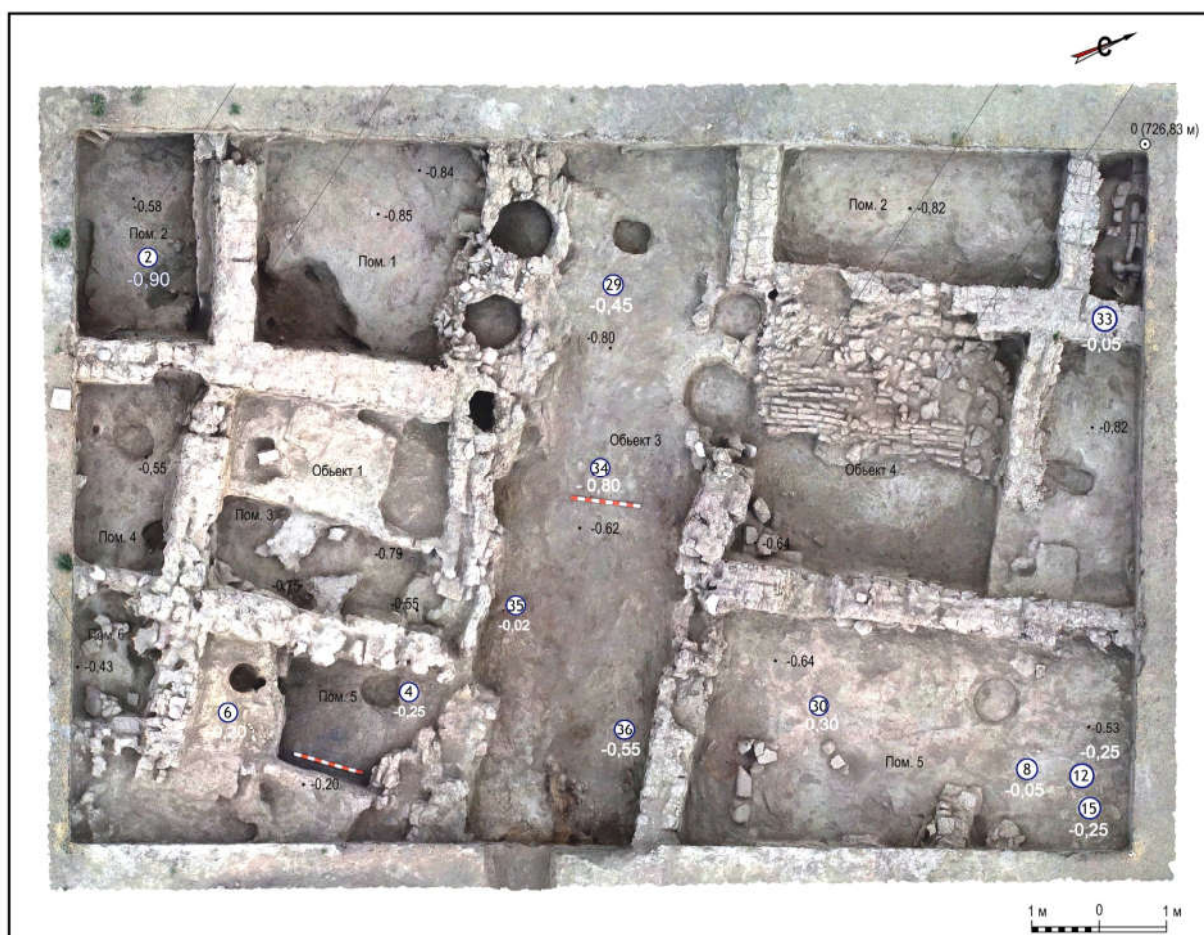
Рис. 3. Распределение нумизматических находок в раскопе № 2а (2022 г.) городища Аспара. Цифры в кружках — номера монет, как в таблицах 1 и 2.