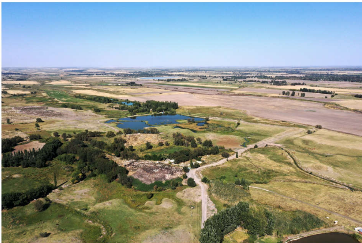
Рис. 4. Аэрофотосъемка городища Шиш-тобе (видна затопленная территория и кладбище, расположившееся на цитадели).