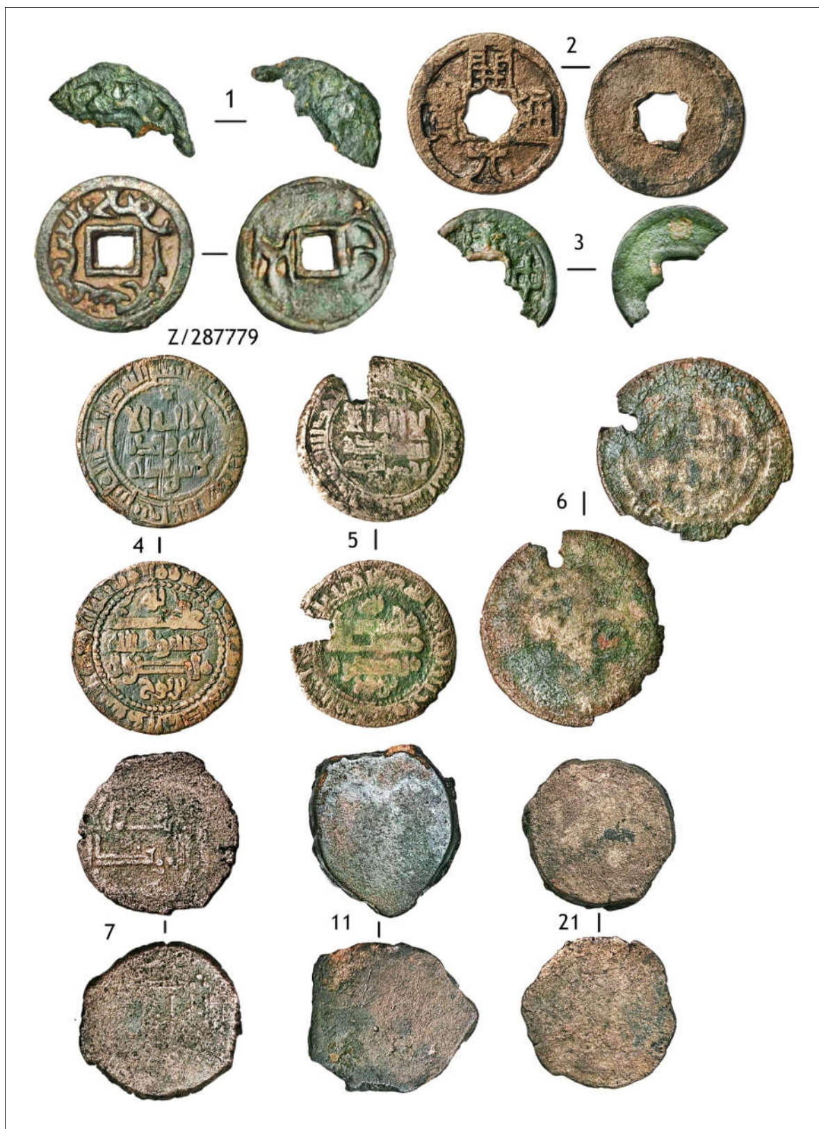
Фототаблица 1. Монеты из находок с городища Аспара. Номера монет соответствуют номерам в таблицах 1 и 2.

Photo table 1. Coins from the finds at the settlement of Aspara. The coin numbers correspond to the numbers in Tables 1 and 2.